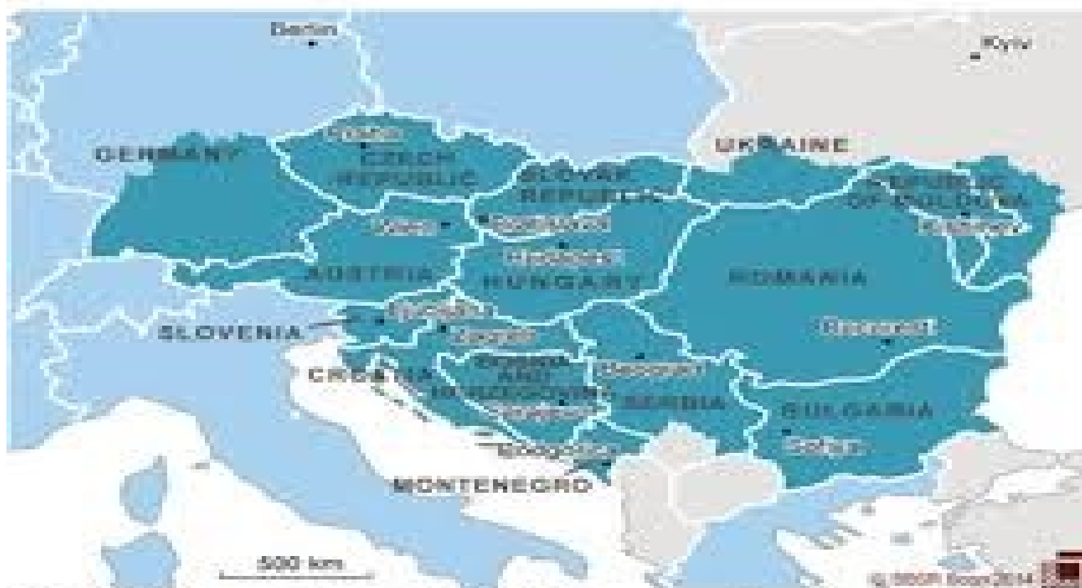
INTERREG B cooperation area 2014-2020

Source: European Commission, as proposed on 18th December 2012 Geometrical base: GPK MAJCOM