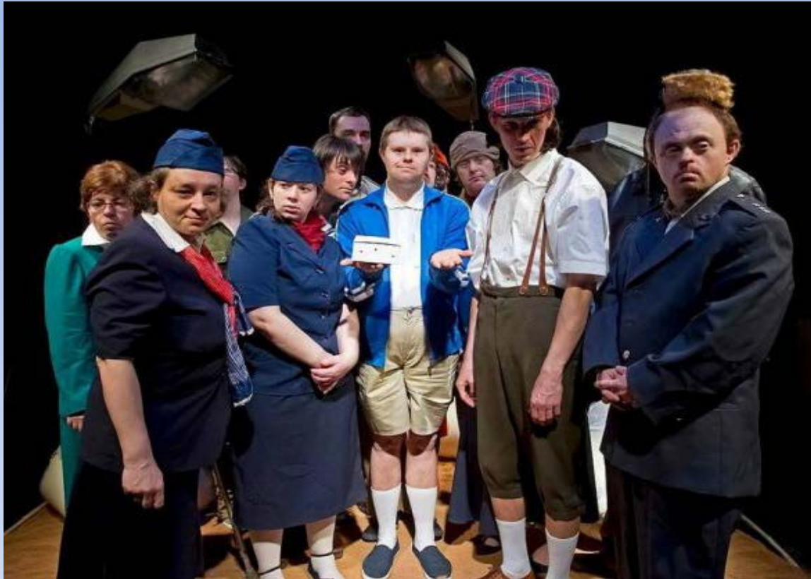
Promised lands – Metropolis, Záhroda – Centrum nezávislej kultúry Festival Embargo/2017, Banská Bystrica, (Divadlo z pasáže - inscenácia Malý princ)